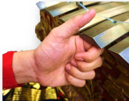
Gambar 5. Posisi tangan nyaplok