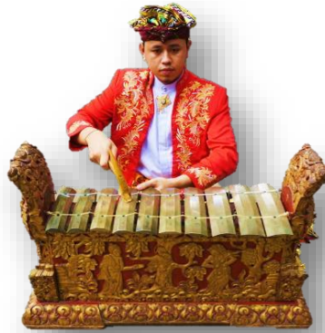
Gambar 2. Posisi Ngebat