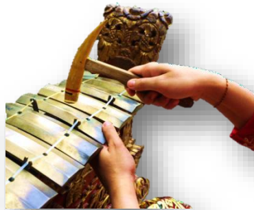
Gambar 3. Posisi nyekel