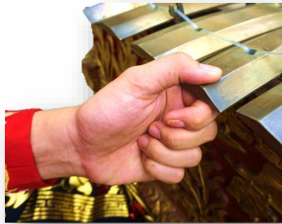
Gambar 6. Posisi tangan nyaket