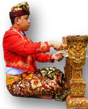
Gambar 1. Posisi Jeg-jeg