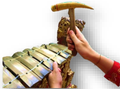
Gambar 4. Posisi ngontel

Sedangkan tetekep/tetekes adalah tutupan bilah nada yang dipukul dan dilakukan seiring dengan pukulan bilah nada dan tepat. Sebagaimana ibarat seekor kepiting dalam mencapit mangsanya. Unsur-unsur pembentuk tetekes, diantaranya: