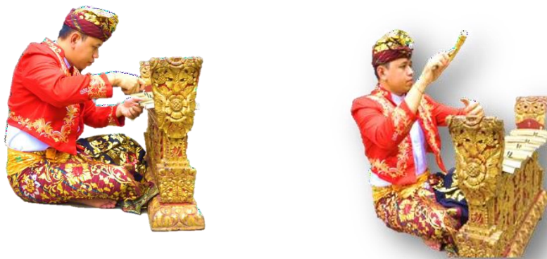
Gambar 8. Gestur ngees (kiri) dan nguncab (kanan)

gestur tubuh yang mentengadah ke atas. Abahan becat, biasanya ditunjukkan dengan gestur tegap ke depan dan dengan kepala manggut- manggut mengikuti tempo permainan yang cepat. Sedangkan abahan adeng, biasanya ditunjukkan dengan gestur tubuh yang lentur atau santai dengan ciri tempo permainan yang relatif pelan. Gestur-gestur ini dapat bernilai sebuah perintah, dan juga lebih banyak ditunjukkan oleh penabuh Ugal, sebagaimana berikut.