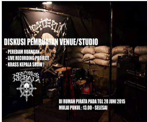
Gambar 4. Flyer diskusi pembuatan studio show (Dokumentasi: Bandung Pyrate Punk , 14 Juni 2015)

Saling bertukar informasi mengenai ilmu pengetahuan dan berbagai hal lain pun menjadi sebuah ciri dari kolektivitas yang terjalin di antara sesama punkers , yang pada akhirnya hal seperti ini akan mendatangkan sebuah keuntungan dari segi benefit yang berujung pada keuntungan profit.