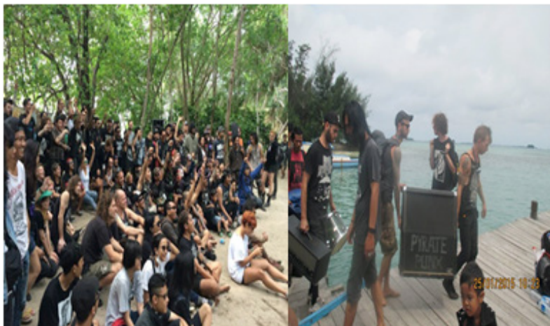
Gambar 3. Pelaksanaan event Libertad Fest

Pada event ini setiap orang yang ingin hadir diharuskan patungan dengan biaya yang telah disepakati bersama oleh panitia untuk menutupi segala hal yang bersangkutan dengan biaya penyelenggaraan. Libertad Fest bukan hanya menjadi sebuah ajang untuk berapresiasi para komunitas punk . Dalam event yang dilaksanakan 3 hari 2 malam ini, terdapat beberapa rangkaian acara yang salah satunya mengadakan bazar merchandise dan karya musik. Dalam event ini bisa ditemukan berbagai macam rilisan dari luar negeri khususnya Asia