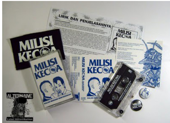
Gambar 1. Salah satu rilisan album Band punk yang bernama Milisi Kecoa

Perlawanan yang dilakukan oleh Bandung Pirate Punk adalah melawan adanya efek dominasi dari industri musik populer. Hal ini berbeda dengan yang di analogikan oleh Scott mengenai resistensi yang dilakukan oleh para petani di Asia Tenggara. Moral ekonomi yang terbentuk pada masyarakat petani di Asia Tenggara