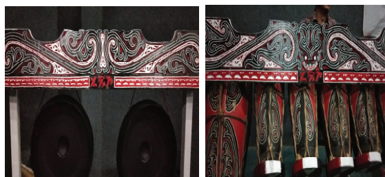
Gambar 1. Alat musik taganing pada pementasan Opera Batak

Musik Bagian 2. Pengantar cerita yang menyanyikan lagu tentang Sisingamanga-