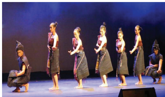
Gambar 3. Tortor Pembuka (mula-mula) Opera Batak Sisingamangaraja di Eksprimental Theatre University Malaya