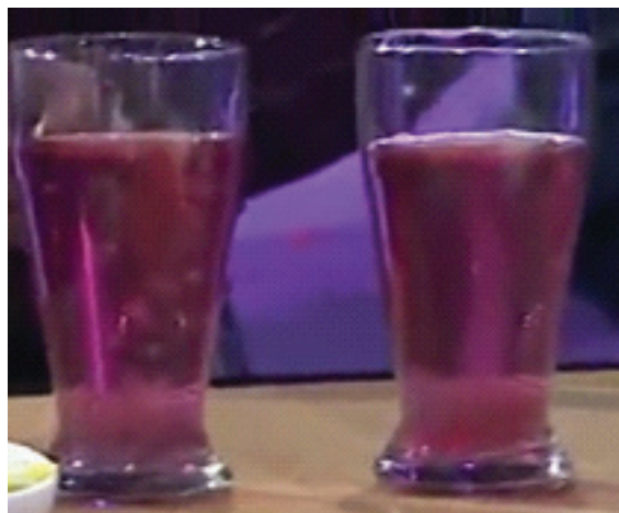
Gambar 4. Es air mata pengantin Riau