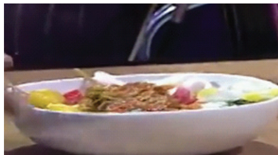
Gambar 3. Bubur pedas Kalimantan Barat

jenis roti paratha ini lebih dikenal dengan nama roti 'cane' atau 'maryam' yang dibawa oleh orang-orang keturunan Arab yang biasa disajikan dengan kuah kambing yang bisa dijumpai di daerah Sumatera.