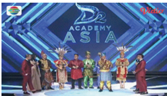
Gambar 1. Para peserta asal Indonesia mengenakan pakaian daerah