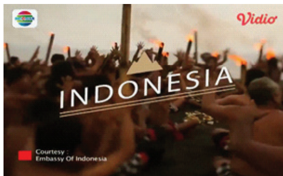
Gambar 5. Tari Kecak Bali.