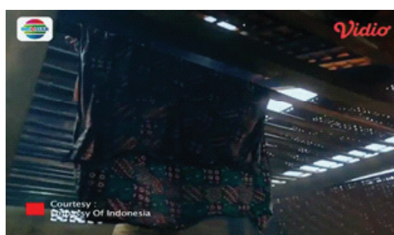
Gambar 7. Proses membuat batik.