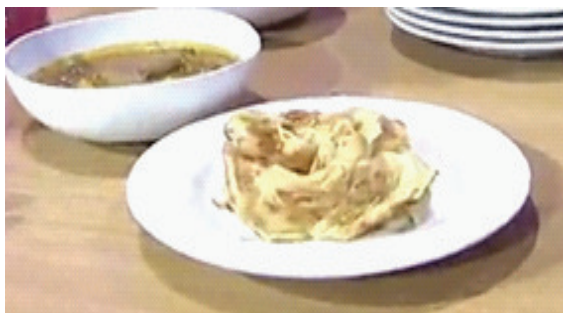
Gambar 2. Roti cane dan kuah kari kambing Sumatera.