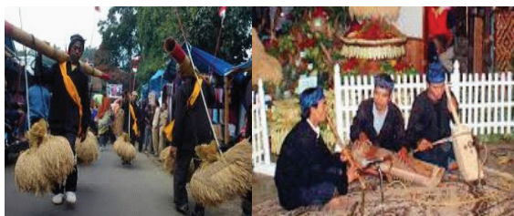
Gambar 5. Jenis Kalangenan

hidup dan berkembang dalam kehidupan masyarakatnya. Sayangnya pemerintah pemkab Sumedang dan pemprov Jawa Barat belum menangkap ini sebagai sebuah media alternatif distribusi informasi bagi kebijakan pemerintah.