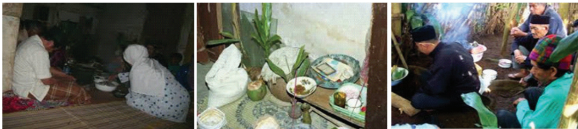
Gambar 3. Tradisi Nyawen. Nyawen pada tahap awal dilaksanakan di rumah rurukan