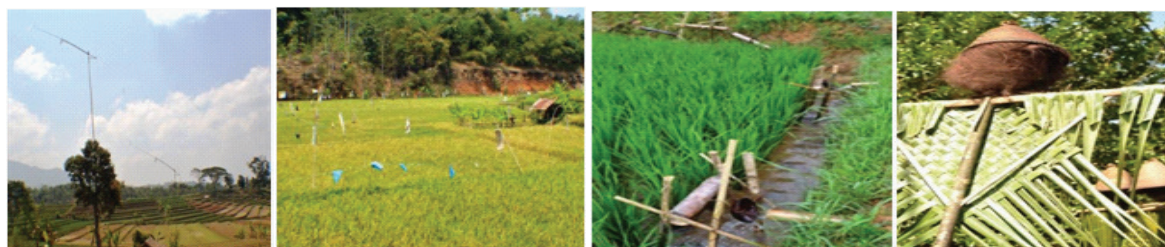
Gambar 4. Contoh Kaulinan lembur