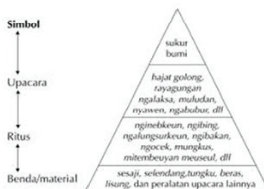
Gambar 2. Model Tujuan Nyawen

Secara simbolik nyawen ini dilaksanakan dengan cara membuat "jimat" setelah dilakukan sebuah acara seperti hajatan golong . Sesaji yang nantinya dijadikan jimat tersebut disimpan di ruang tengah dan disatukan dengan makanan yang dibawa dari rumah masing-masing warga. Setelah selesai tawasulan (berdo'a) bersama-sama, jimat tersebut dibagikan ke masing-masing keluarga, jimat tersebut dipasang di dua tempat; 1) disimpan di atas pintu rumah, dan 2) disawenkeun (disimpan) di lokasi/lahan kebun/sawah masing-masing yang disimpan di saung atau pusat lahan pertanian masing-masing.