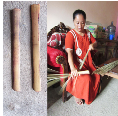
Gambar 3. Alat untuk meluruskan tiohu

Mengenai peralatan, para perajin tiohu Gorontalo hanya menggunakan alat tradisional dari bilah bambu yang dibuat sendiri. Alat tersebut terutama digunakan untuk meluruskan dan memipihkan (meratakan dan meluruskan) batang tiohu