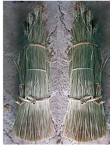
Gambar 2. Tiohu dari pemasok bahan baku

Bahan baku berupa tiohu (mendong) yang digunakan para perajin dibeli dari petani sebagai pemasok bahan baku. Bahan tersebut diperoleh dengan cara budidaya atau tumbuh liar di tepi persawahan. Panen tiohu yang dibudidayakan dilakukan pada umur