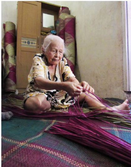
Gambar 1. Perajin tiohu tertua di Gorontalo

potensi dalam mendukung pengembangan kerajinan tiohu Gorontalo, baik dalam berinovasi maupun memproduksi secara konsisten.