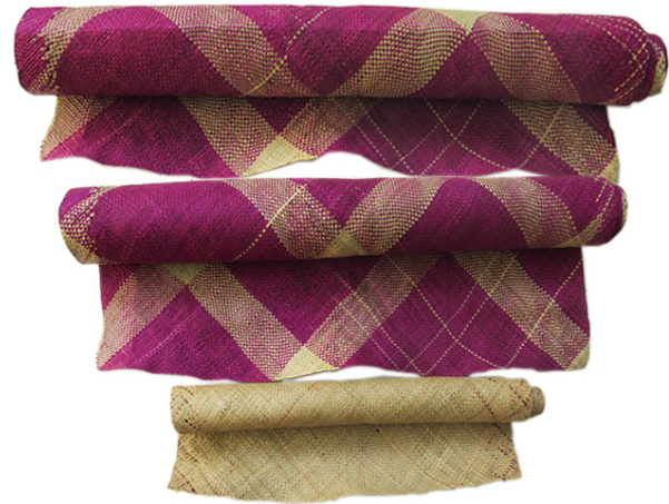
Gambar 5. Tikar tiohu (mendong) Gorontalo

Bentuk produk seni kerajinan tiohu Gorontalo yang diproduksi para perajin tradisional berupa tikar, dengan ukuran dan warna yang berbeda-beda (lihat pada gambar 5). Tikar kecil dibuat dengan ukuran 100 x 65 cm, tikar sedang ukuran 170 x 90 cm. dan tikar besar berukuran 200 x 180 cm. Tikar dibuat dengan dua jenis warna yaitu natural dan berwarna-warni sesuai permintaan pasar atau konsumen. Berdasarkan observasi, masyarakat Gorontalo memfungsikan produk