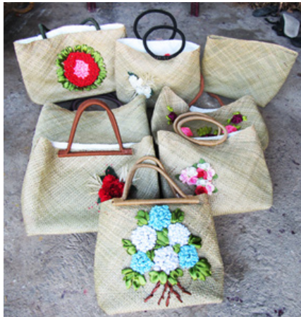
Gambar 6. Produk kerajinan tiohu Gorontalo baru

membeli, dorang (mereka pen.) lebih memilih karpet untuk alas ... jadi makin susah jual tikar tiohu " (wawancara, 20 Juli 2022). Perajin tiohu Gorontalo tampaknya telah menyadari bahwa produk yang dihasilkan (tikar) makin kurang diminati karena kalah saing dengan baru (karpet), tetapi mereka belum berani melakukan inovasi untuk mengantisipasi permintaan pasar. Secara umum, inovasi produk seni kerajinan tiohu Gorontalo masih tergolong rendah dan para perajin belum berani mencoba membuat produk lain yang lebih menarik sesuai kebutuhan pasar (Otaya, Tjabolo, & Husain, 2019, hlm. 70)