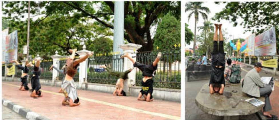
Gambar 3: Proses latihan "Interogasi Tubuh" di ruang publik

Pemilihan ruang publik dan ruang terbuka sebagai tempat pertunjukan teater tubuh, Mason (1992: 85-86) menjelaskan bahwa pada pertunjukan di luar ruangan, perubahan kondisi dan gangguan di setiap pertunjukan adalah peristiwa unik, menuntut pemain untuk memiliki semangat dan energi yang besar dan kemungkinan untuk menggunakan materi, lokasi, dan efek yang berbeda, karena sebaliknya pertunjukan di dalam ruangan cenderung menjadi lebih dari sebuah produk yang mudah diulang. Pengulangan memberi kesempatan untuk penataan tetapi sekaligus juga kurang memberikan fleksibilitas. Penulis dalam proses penciptaan teater tubuh pada pementasan di ruang publik dan di dalam gedung mengalami peristiwa unik dan proses kreatif dari pemain yang berbeda, sedangkan untuk proses di dalam gedung masuk pada proses pengulangan dari adegan-adegan yang dibuat.