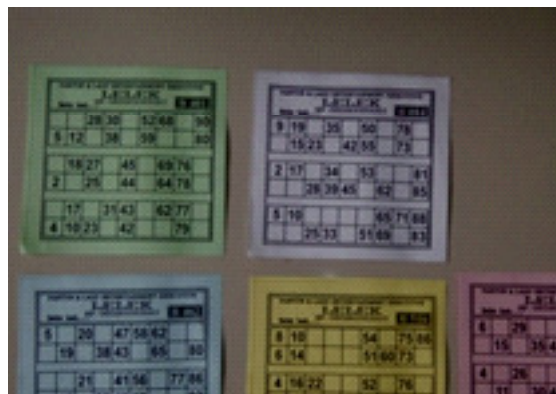
Gambar 4. Kupon Kertas persegi empat yang berisi angka-angka yang dipegang oleh pendendang Kim

Dadu dalam pertunjukan Kim bermacam-macam bentuknya tergantung pada selera pendendang Kim. Ada dadu yang berbentuk segi delapan, segi empat, dan berbentuk bulat. Dadu tersebut terbuat dari plastik fiber dengan diameter lebih kurang 2 cm. Dadu inilah yang diambil oleh si pendendang Kim dari kaleng batu kuncang