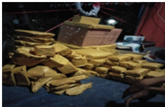
Gambar 7. Beberapa properti yang dipersiapkan untuk para pemenang