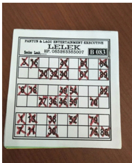
Gambar 1. Contoh kupon yang telah ditandai secara keseluruhan (penuh)

penerang, kompor, sepatu, pakaian, tas dan lain-lain. Properti ini harus diberikan kepada pihak yang menang.