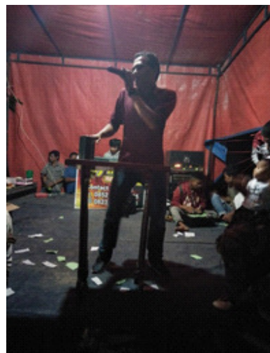
Gambar 9. Meja tempat kaleng batu kuncang yang harus ada di pentas tempat pertunjukan Kim

Bentuk hadiah biasanya sesuai dengan kemampuan tuan rumah dan teman-teman sehoobi tanpa memperhitungkan besar atau kecil hadiah yang diperebutkan. Hadiah-hadiah tersebut diberikan secara cuma-cuma kepada penonton atau peserta yang dinyatakan menang dalam permainan. Dapat ditegaskan di sini bahwa para penonton atau peserta yang ikut bermain tidak dipungut bayaran sepeser pun, karena tujuan dari pertunjukan ini adalah untuk hiburan semata.