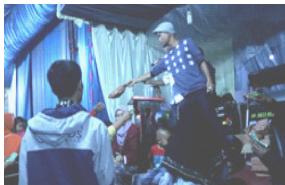
Gambar 8. Penyerahan hadiah kepada salah seorang pemenang.

mendengar nomor saja, akan tetapi ada juga yang lebih senang mendengarkan lagu-lagu yang dibawakan oleh si pendendang Kim sambil berjoget-joget. Hal ini jugalah yang membuat pertunjukan Kim ini semakin digemari dari hari ke hari, baik tua maupun muda.