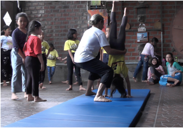
Gambar 2. Proses Literasi Tubuh (Raga)

Karya tari “Sarah” berbentuk tari kontemporer bertema, yang menjadikan kehadiran tubuh sebagai media ungkap. Tubuh yang bergerak menghadirkan kekuatan simbol di atas panggung merupakan hal yang ingin dicapai melalui tubuh anak-anaki. Kecocokan dalam memilih materi atau cara untuk sebuah pelatihan atau pengajaran sangatlah penting, seperti yang dijelaskan oleh Kuswana bahwa “bagaimana perkembangan ragam berpikir digunakan dalam mencari, memilah, dan memilih kecocokan dalam pendekatan pembelajaran” (2012: 15).