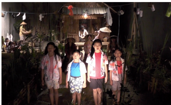
Gambar 3. Karya Tari Kontemporer "Sarah"

beradaptasi, menunjukkan perilaku ataupun sikap, serta menyampaikan berbagai keberhasilan. Bishop dan Curtis dalam Iswinarti mengklasifikasi tradisi-tradisi bermain menjadi tiga kelompok, yaitu permainan yang sarat dengan muatan verbal, permainan yang sarat dengan muatan imajinatif, dan permainan yang sarat dengan muatan fisik (2017: 8).