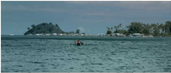
Gambar 2. Salawaku menaiki perahu ditengah lautan.

Adegan ini menceritakan salawaku berlayar sendiri setelah ia memberi tahu kawanua bahwa Binaiya ada di piru, Tetapi kawanua tidak ikut pergi karena merasa itu terlalu jauh, akhirnya Salawaku pergi sendiri dan mencuri sampan milik ayah kawanua. Dalam adegan ini, gambaran maskulinitas Salawaku terlihat ketika salawaku berani memutuskan untuk pergi sendiri menyebrang pulau menggunakan sampan, ia tidak peduli resiko yang akan ia hadapi, ini menunjukkan sifat sifat maskulinitas yang diutarakan david dan branon yaitu menunjukkan keberanian.