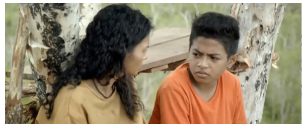
Gambar 7. salawaku menyuruh kawanua untuk menemani binaiaya.

Adegan ini menceritakan tentang Salawaku yang meminta Binaiaya untuk menerima kembali Kawanua, karena Salawaku ingin bayi yang ada di dalam kandungan Binaiaya merasakan adanya bapak, lalu Salawaku memanggil Kawanua untuk datang menemui Binaiaya. Adegan ini menceritakan tentang kepintaran Salawaku untuk mengambil keputusan, ia tidak