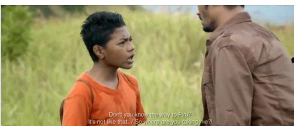
Gambar 6. Salawaku marah kepada kawanua

Adegan ini menceritakan ketika salawaku marah karena mobil yang ditumpangi ternyata