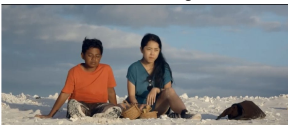
Gambar 3. Salawaku menolong saras.

Adegan ini menceritakan ditengah perjalanan salawaku melihat seorang wanita yang bernama saras yang terdampar di Gundukan Pasir Putih, Salawaku pun menghampirinya dan menanyakan apa yang terjadi, tetapi wanita itu diam saja, lalu salawaku memberikan bekal makanan kepada wanita itu dan akhirnya wanita itu bisa berbicara, Salawaku lalu memberi tumpangan dan membawa wanita itu ke daratan. Di sini Salawaku berani untuk menolong saras yang sendiri, ia menjadi pemimpin untuk membawa Saras menuju daratan, ini menunjukkan salah satu sifat maskulinitas yaitu menjadi seseorang yang penting, Salawaku menjadi penting bagi Saras karena Salawaku membantu Saras.