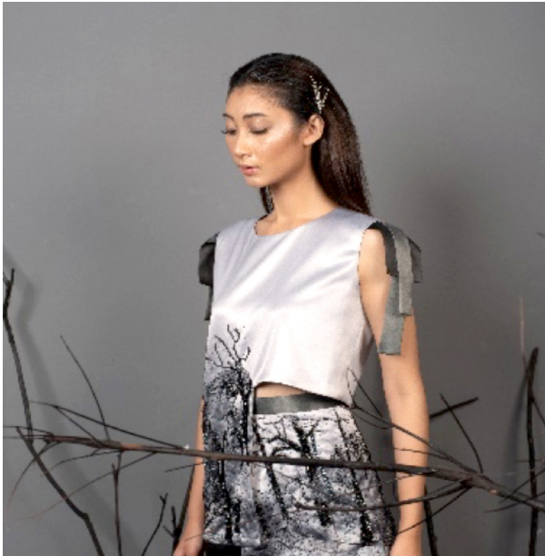
Gambar 12. Visualisasi Desain Tas 2