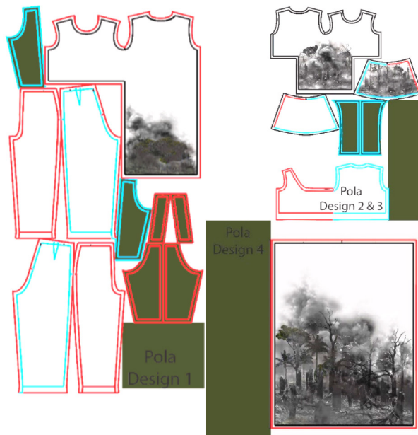
Gambar 10. Input Motif pada Pola Digital

Saran yang dapat peneliti sampaikan setelah melakukan penelitian 'Kebakaran Hutan Kalimantan Sebagai Inspirasi pada Rancangan Pakaian Ready to Wear' ini adalah: