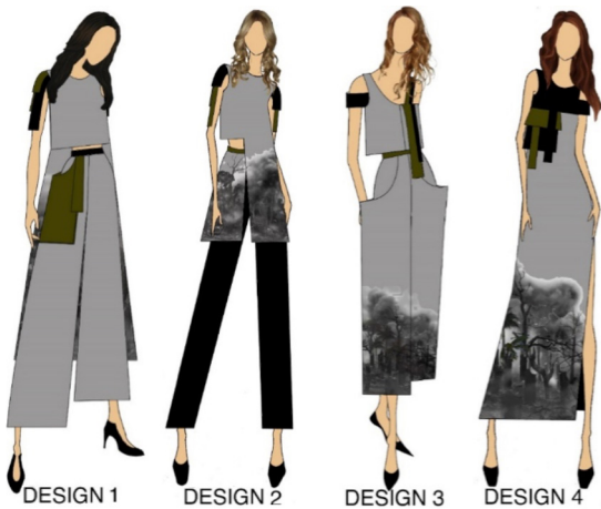
Gambar 8. Desain Pakaian Ready to Wear

ditarik sehingga memudahkan penulis membuat garis yang lebih presisi.