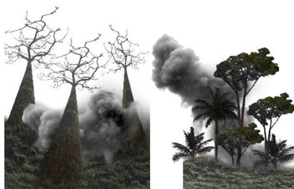
Gambar 4. Motif 1 dan 2