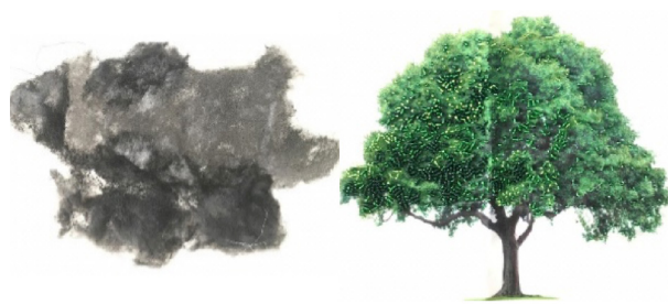
Gambar 3. Eksplorasi Modular Dakron dan Beads