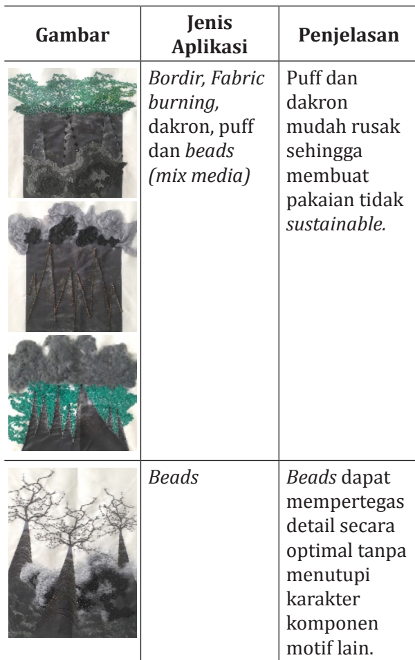
Tabel 1. Pengaplikasian Embellishment