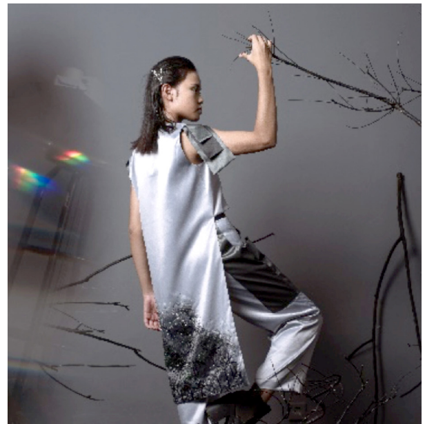
Gambar 11. Visualisasi Desain Tas 1

untuk lebih mendalami bentuk dan jenis karakter pohon khas Kalimantan yang lebih variatif dan identik dengan Kalimantan agar komposisi image Kalimantan dapat tergambar dengan lebih jelas.