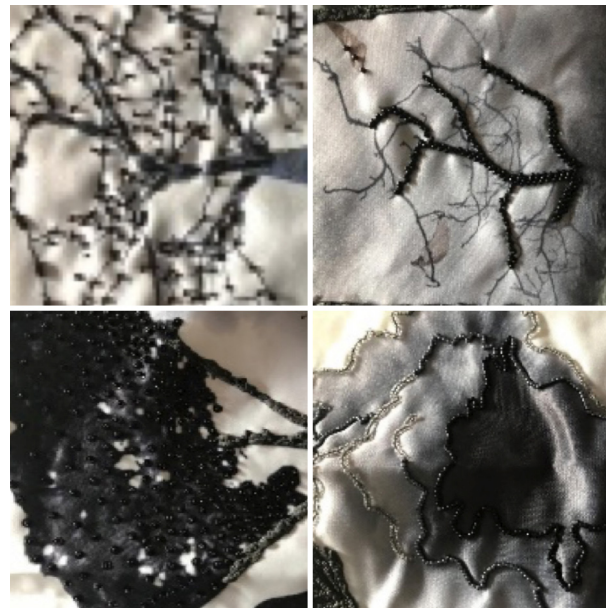
Gambar 6. Hasil Eksplorasi Teknik 1 -4