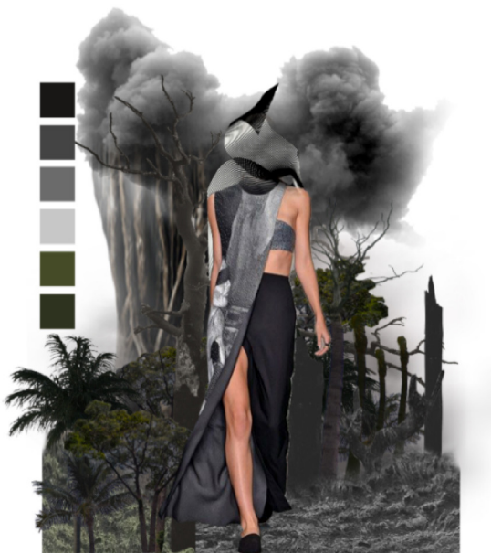
Gambar 1. Imageboard