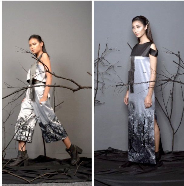
Gambar 13. Visualisasi Desain Tas 3 & 4