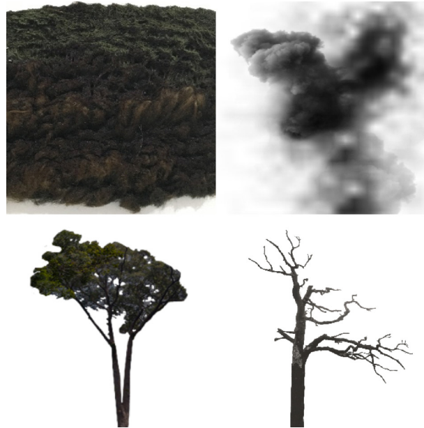
Gambar 2. Komponen Modul

dapat dicapai dengan optimal. Sedangkan dari hasil eksplorasi rekalar dengan material beads, dakron, puff, dan fabric burning, material beads lebih optimal untuk diaplikasikan sebagai embellishment karena dapat mempertegas detail tanpa menutupi karakter dari motif yang sudah dibuat.