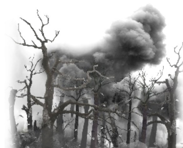
Gambar 5. Motif 3

gambar dan perspektif sehingga mencapai suasana kebakaran hutan