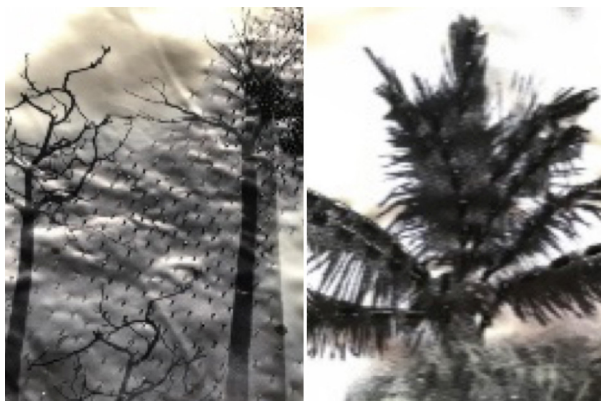
Gambar 7. Hasil Eksplorasi Teknik 5 -6