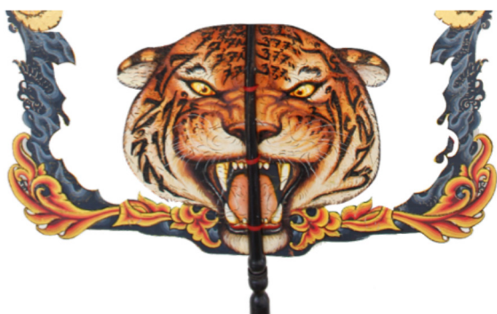
Gambar 4. Maung pada gunung sunda sawawa