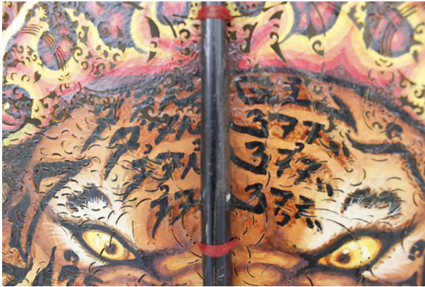
Gambar 6. Silih asah, asih, asuh pada gunungan sunda sawawa