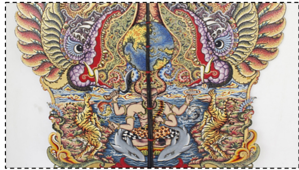
Gambar 3. Lengkeh Gunungan Sunda Sawawa (Sumber: Dokumentasi Penulis, 2018)