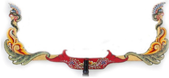
Gambar 2. Palemahan Gunungan Sunda Sawawa