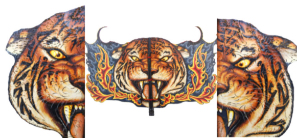
Gambar 5. Siliwangi pada gunung sunda sawawa

Kalpavrksa ini ditemukan pada prasasti Yupa tahun 400 M.