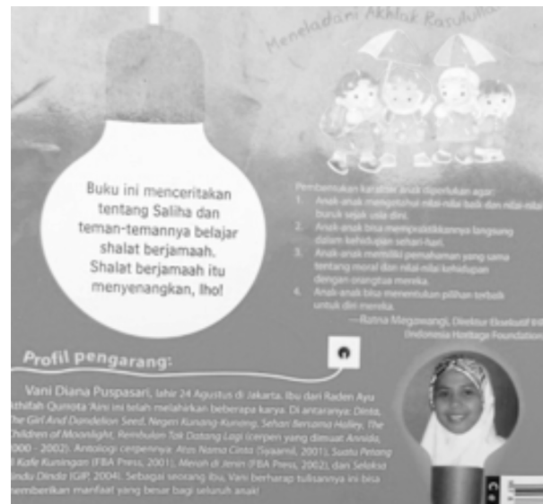
Gambar 14. Sampul Belakang Buku Asyiknya Shalat Berjamaah (The Fun of Doing Joint Prayer)

Gambar tersebut bisa menjadi teladan yang baik bagi anak maupun orangtua untuk membudayakan shalat berjamaah di rumah.