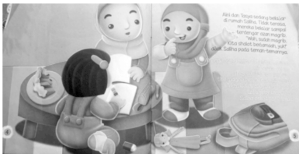
Gambar 3. Isi Buku Asyiknya Shalat Berjamaah (The Fun of Doing Joint Prayer)