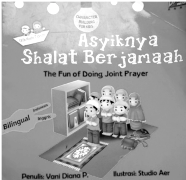
Gambar 1. Sampul Depan Buku Asyiknya Shalat Berjamaah (The Fun of Doing Joint Prayer)