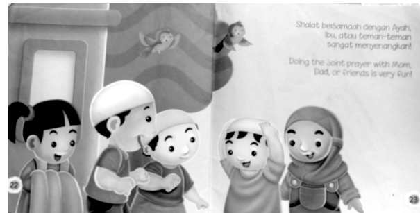
Gambar 12. Isi Buku Asyiknya Shalat Berjamaah (The Fun of Doing Joint Prayer) (Sumber: Vani Diana P., 2010)