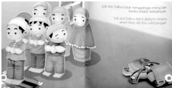
Gambar 11. Isi Buku Asyiknya Shalat Berjamaah (The Fun of Doing Joint Prayer)