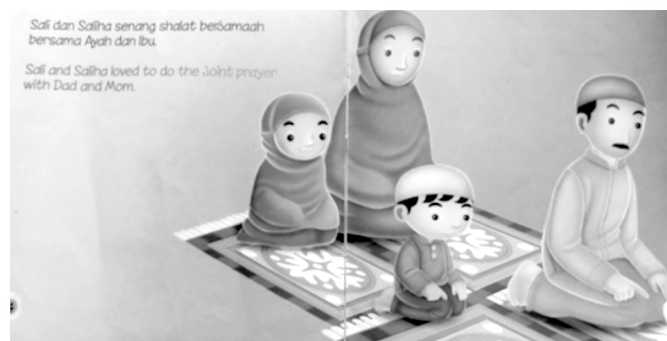
Gambar 8. Isi Buku Asyiknya Shalat Berjamaah (The Fun of Doing Joint Prayer)