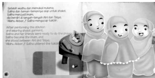
Gambar 4. Isi Buku Asyiknya Shalat Berjamaah (The Fun of Doing Joint Prayer)