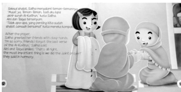
Gambar 7. Isi Buku Asyiknya Shalat Berjamaah (The Fun of Doing Joint Prayer)