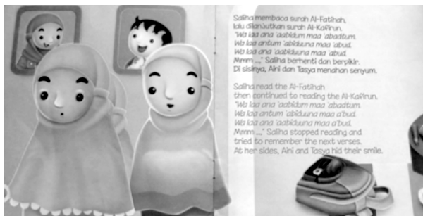
Gambar 5. Isi Buku Asyiknya Shalat Berjamaah (The Fun of Doing Joint Prayer)