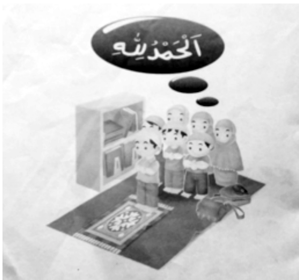
Gambar 13. Isi Buku Asyiknya Shalat Berjamaah (The Fun of Doing Joint Prayer)