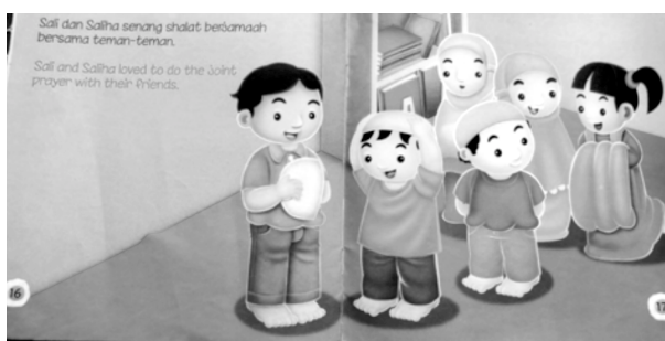
Gambar 9. Isi Buku Asyiknya Shalat Berjamaah (The Fun of Doing Joint Prayer)