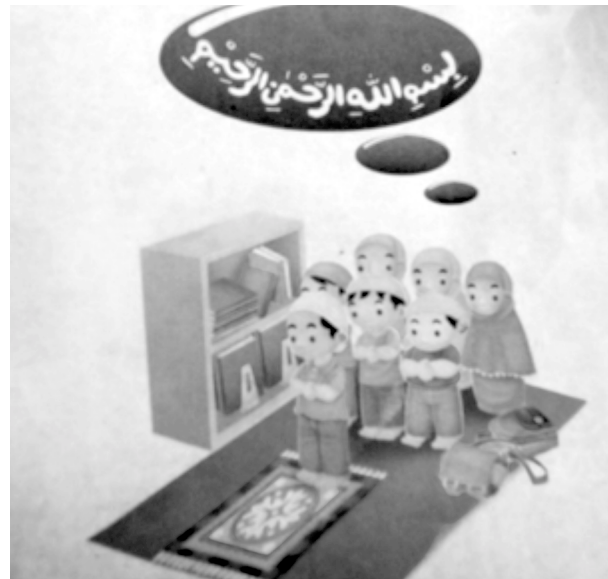
Gambar 2. Isi Buku Asyiknya Shalat Berjamaah (The Fun of Doing Joint Prayer)