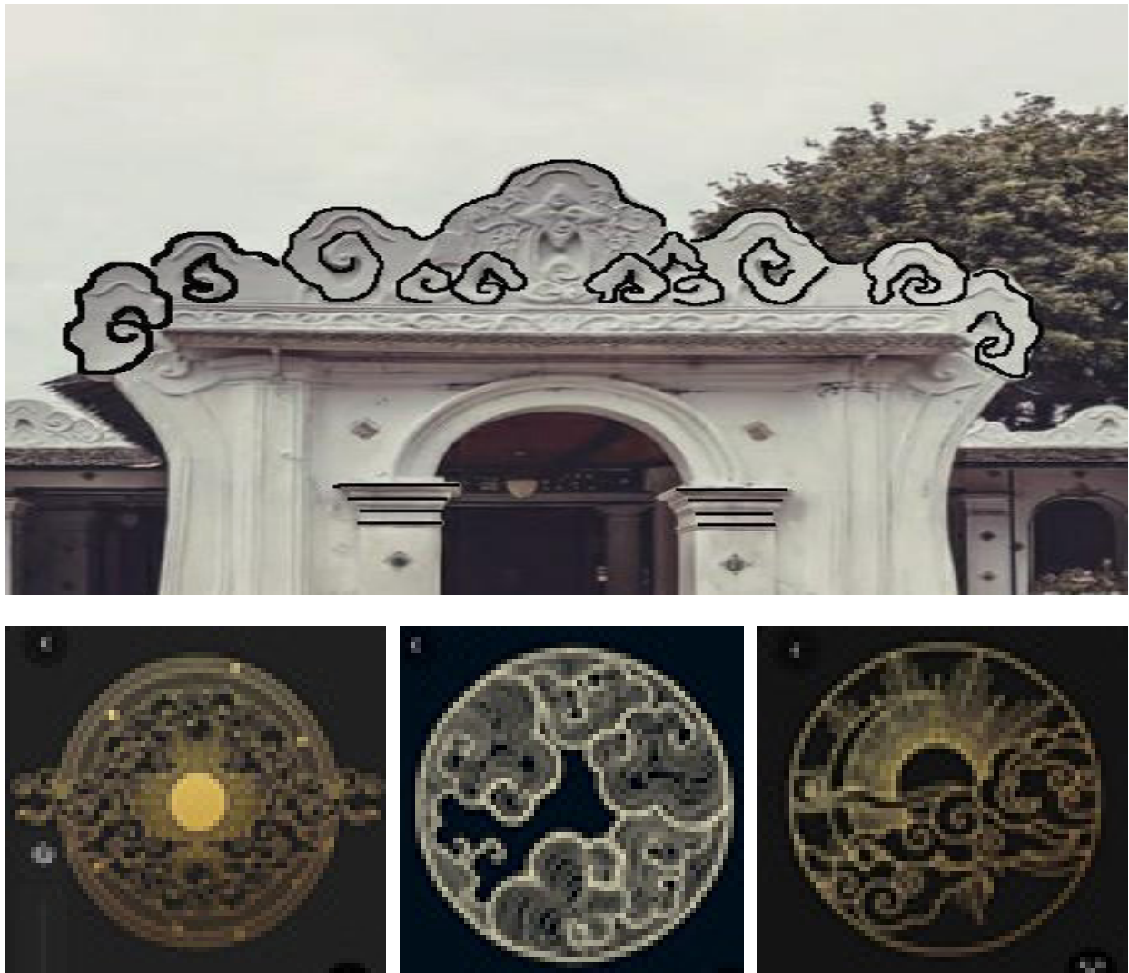
Gambar 3. Referensi Visual Bentuk Motif Lingkaran

Mahasiswa Tata Rias Busana merespon motif wadasan dengan menggabungkan ornamen wadasan yang ada pada Gapura Kutagara Wadasan dan ornamen geometris seperti: lingkaran dan garis agar nuansanya terlihat lebih modern. Sebelum membuat motif, mahasiswa melakukan eksplorasi pencarian bentuk motif wadasan dan referensi bentuk ornamen geometris lingkaran.