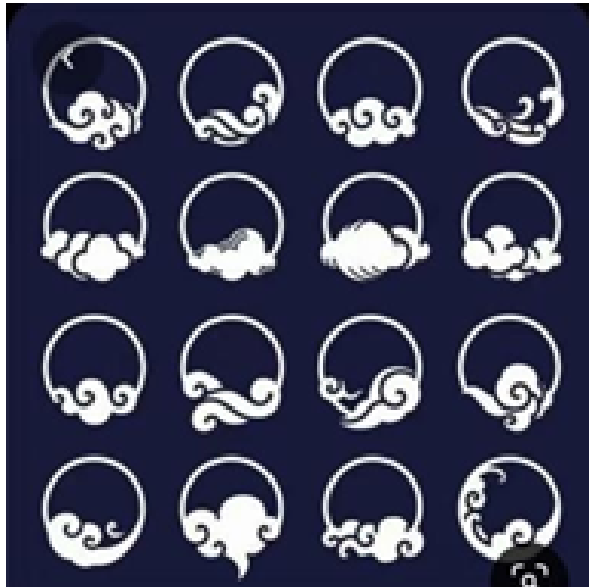
Gambar 4. Referensi Visual Bentuk Motif Lingkaran