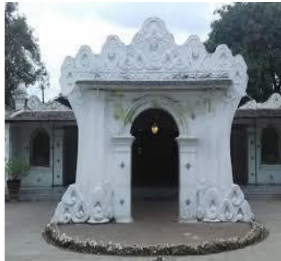
Gambar 1. Pengaplikasian motif wadsan pada Patung Batu Insan Kamil,

Menurut Primawan Romanda dalam Ilmi (2012: 14) motif wadsan memiliki filosofi makna dari kekuatan pondasi keimanan, karena motif wadsan diambil dari bentuk batu karang