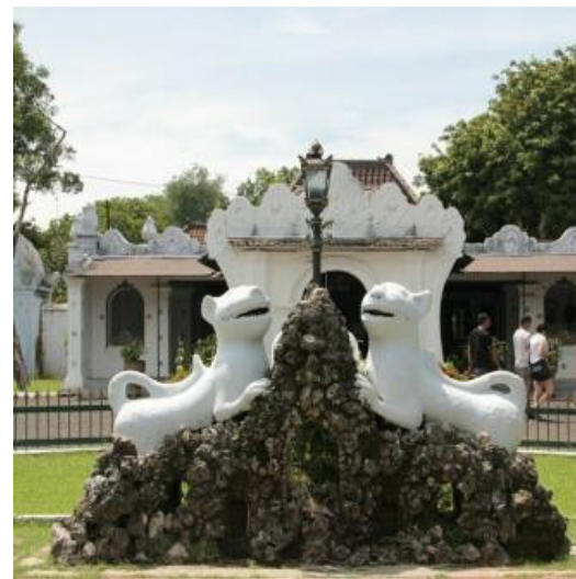
Gambar 2. Aplikasi Motif Wadsan pada Gapura Kutagara

vertikal ke atas yang menunjukkan hubungan pada Tuhan Yang Maha Esa. Motif wadsan selalu berdampingan dengan motif mega mendung karena bentuknya yang sangat mirip. Namun, kedua motif tersebut memiliki perbedaan dari segi posisi bentuk yaitu motif wadsan dengan bentuk vertikal sedangkan motif mega mendung dengan bentuk horizontal. Selain itu, motif wadsan dan motif mega mendung memiliki makna dan filosofi yang berbeda namun memiliki satu kesatuan.