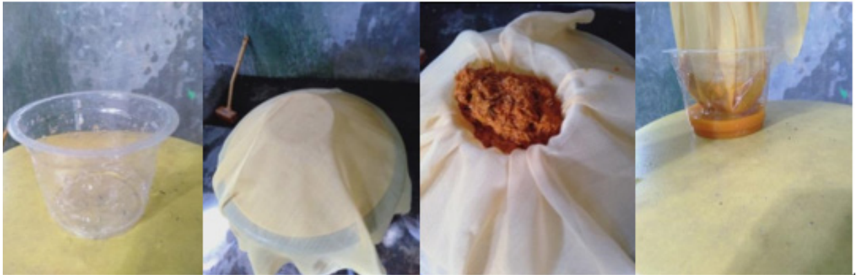
Gambar 4. proses penyaringan bubuk bunga dengan menggunakan saringan kain