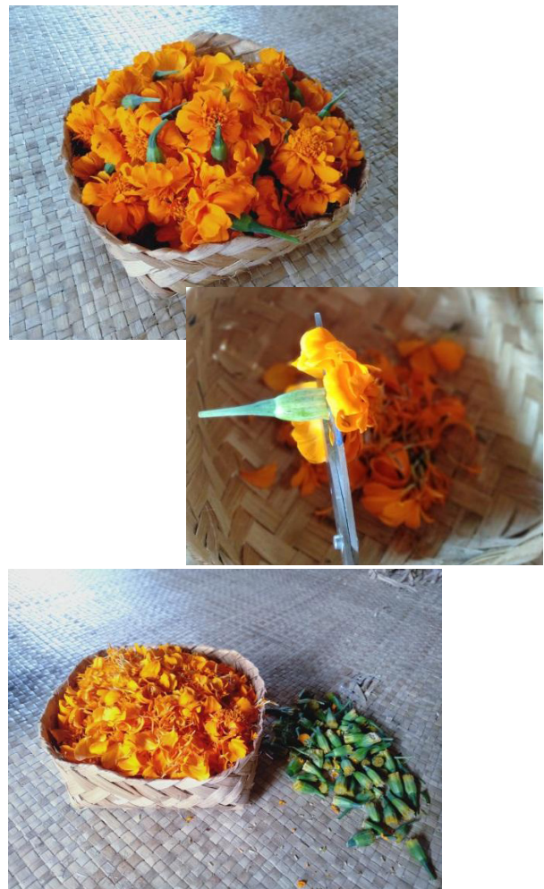
Gambar 2. Bahan baku yang telah dipetik dan dipisahkan dari kelopak bunga