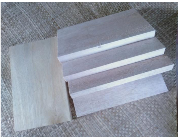
Gambar 7. persiapan media kayu sebagai media pertama yang akan di eksperimenkan

supaya tidak bercampur lagi dengan ekstrak. Ketika airnya tinggal sedikit, bisa disedot dengan menggunakan pipet, maka ekstrak bunga mexican gold , kenikir atau bunga tahi kotok bisa digunakan sebagai cat lukis. Karena berupa zat cair (liquid), untuk menjaga tidak terjadi proses pembusukan sebaiknya ekstrak warna disimpan dilemari pendingin