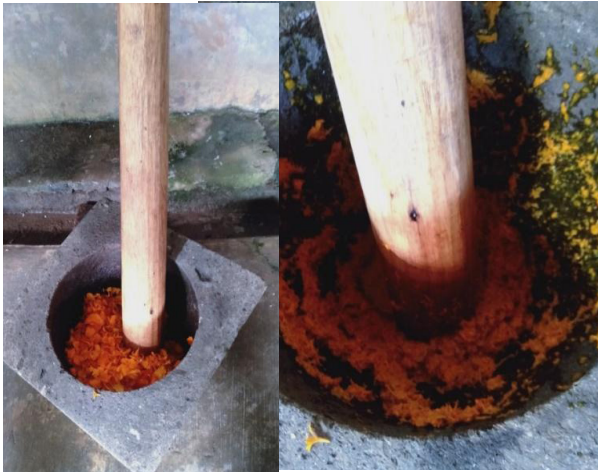
Gambar 3. Proses pennumbukan bahan baku dengan menggunakan lumpang batu (jubleg)

dan sudah mekar, bukan yang masih kecil atau kuncup dan bukan juga yang sudah tua dengan warna jingga cenderung ke coklatan. Dalam pemetikannya gunakan alat pemotong atau gunting supaya tidak merusak tanaman