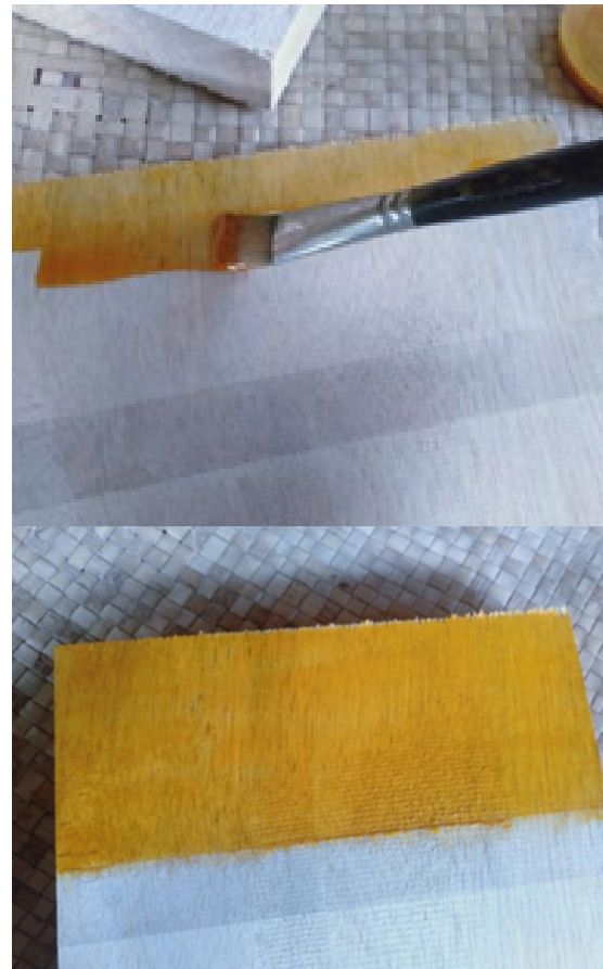
Gambar 8. Eksperimen pengecatan tahap 1 (layer 1)

Setelah cat ekstrak warna tumbuhan telah disiapkan, tahap selanjutnya adalah