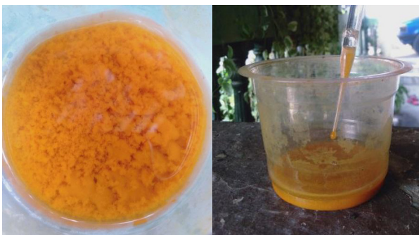
Gambar 6. Endapan ekstrak warna yang telah dipisahkan dengan air pelarut

mengawetkan warna supaya tidak cepat pudar dan tidak terjadi percepatan pembusukan. Selain garam dapat dipergunakan juga cuka atau tawas. Garam dikenal masyarakat sebagai