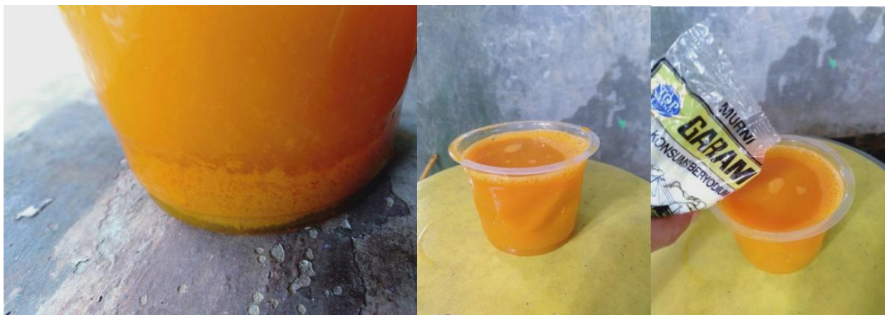
Gambar 5. Air perasan bunga yang sedang diendapkan untuk memperoleh ekstrak warna