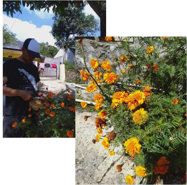
Gambar 1. Bunga penghasil warna jenis mexican marigold

Tahap pertama untuk eksperimen 1 ini adalah pengumpulan bahan baku bunga dengan memetik dan memilih bunga-bunga yang masih segar dengan warnanya yang masih kuning