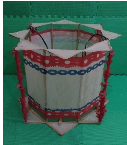
Gambar 3. Bangun luar Lampion Tengtengan

Pemasangan kertas putih pada bangun luar memutar kerangka Tengtengan berikut menutup ruang bangun persegi tiga pada atas maupun bawah dengan cara direkatkan menggunakan lem dan potong sesuai besaran ukuran.