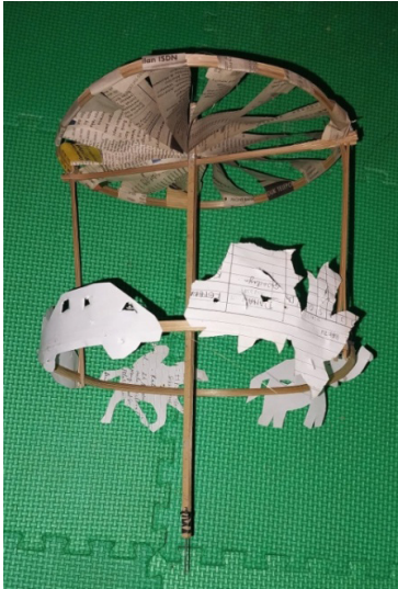
Gambar 4. Bangun dalam Lampion Tengtengan