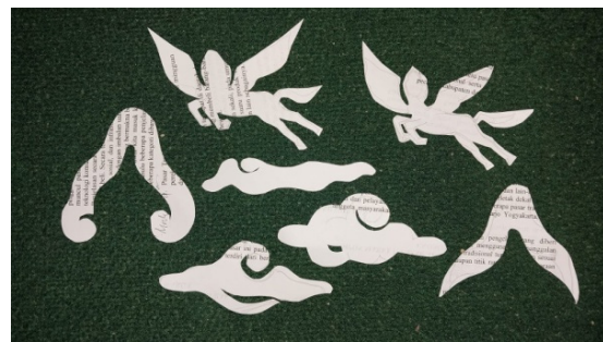
Gambar 7. Potongan siluet stilasi dari motif batik Buraq, Gunung dan Awan/Mega

Tengtengan bukan hanya indah secara visualnya saja namun demikian juga menyampaikan pesan dan pemaknaan tersendiri dalam tampilannya.