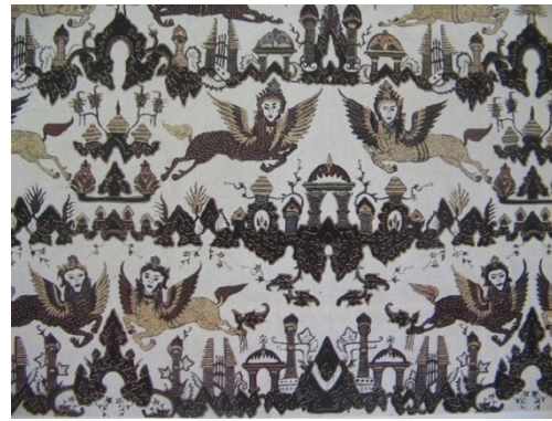
Gambar 6. Batik Motif Buraq

Tampilan siluet lampion yang ditempelkan pada bagian tengah lampion Tengtengan dengan gambar Buraq beserta motif Megamendung dan beberapa tambahan sebagai pelengkap. Hal ini tentunya akan menambah nilai visual lampion