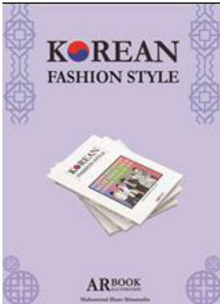
Gambar 9. Poster