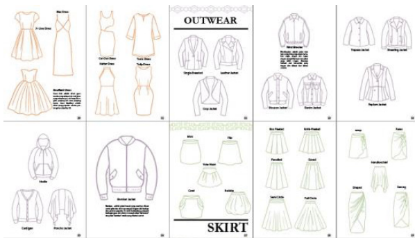
Gambar 3. Ilustrasi Informasi 2