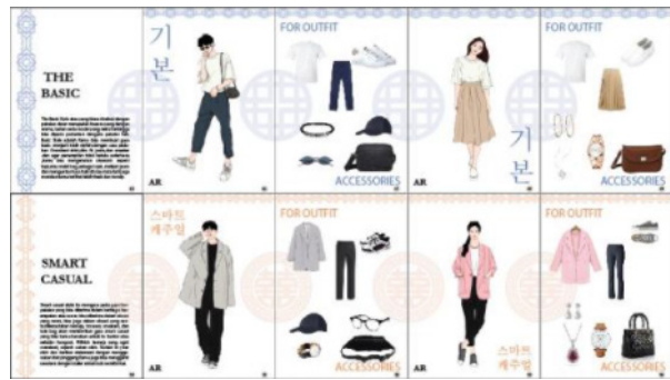
Gambar 6. Ilustrasi Informasi 5

Facebook dipilih karena telah menjadi media sosial paling populer di Indonesia. Website ini merupakan situs jejaring sosial berbasis