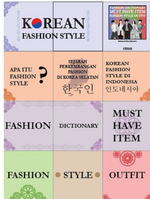
Gambar 11. Feed Instagram