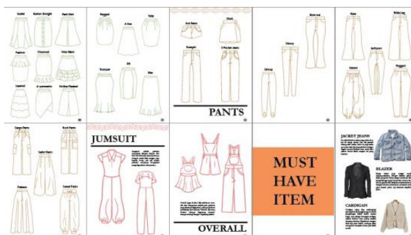
Gambar 4. Ilustrasi Informasi 3