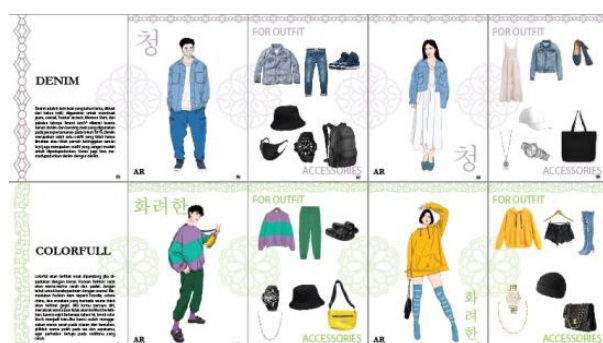
Gambar 7. Ilustrasi Informasi 6