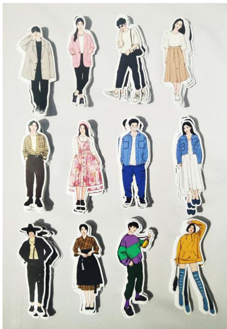
Gambar 10. Stiker