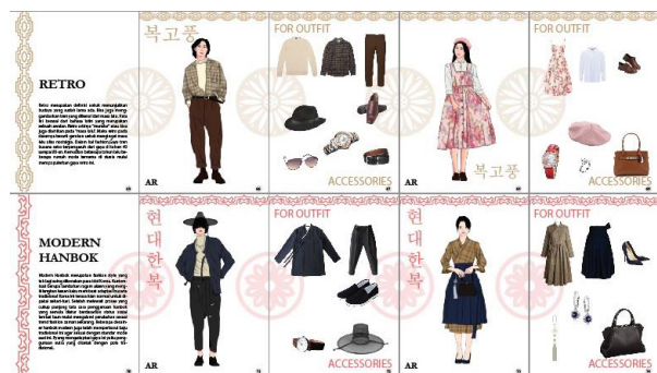
Gambar 8. Ilustrasi Informasi 7

web dan banyak penggunaannya. Penggunaan Facebook sebagai media pendukung promosi dari buku ilustrasi Korean fashion style dengan teknik AR ini memiliki potensi yang cukup besar.