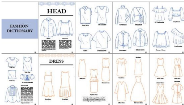
Gambar 2. Ilustrasi Informasi 1