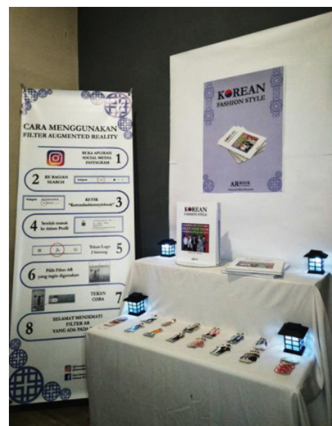
Gambar 13. Display

dan x-banner . Bentuk penyajian karya dibuat dengan kombinasi warna abu-abu dan putih yang memberikan kesan simple dan minimalis , ditambahkan dengan ornamen lampu di setiap ujung meja.