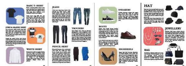
Gambar 5. Ilustrasi Informasi 4

peminat dan diketahui sekarang penggunaannya telah mencapai lebih dari satu milyar.