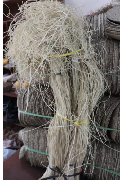
Gambar 1. Bahan Baku Anyaman dari Pandan

Menganyam bisa menggunakan media apa saja. Masyarakat Jawa Barat khususnya di Tasikmalaya biasa menggunakan daun pandan, bamboo, dan mendong untuk menganyam. Ketiga media tersebut memiliki karakteristik dan