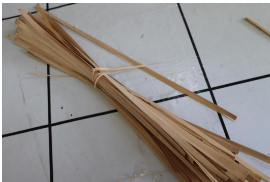
Gambar 3. Bahan Baku Bambu Kasar