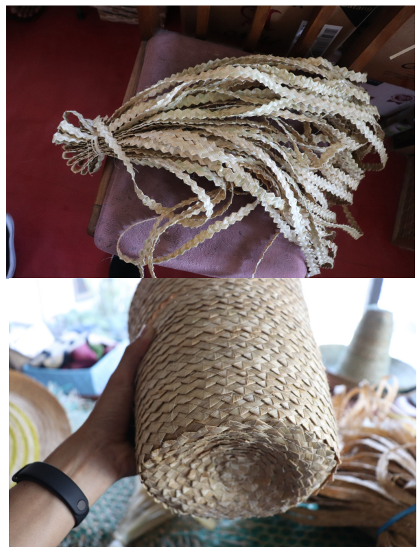
Gambar 6. Pola dan Produk Pola Keping