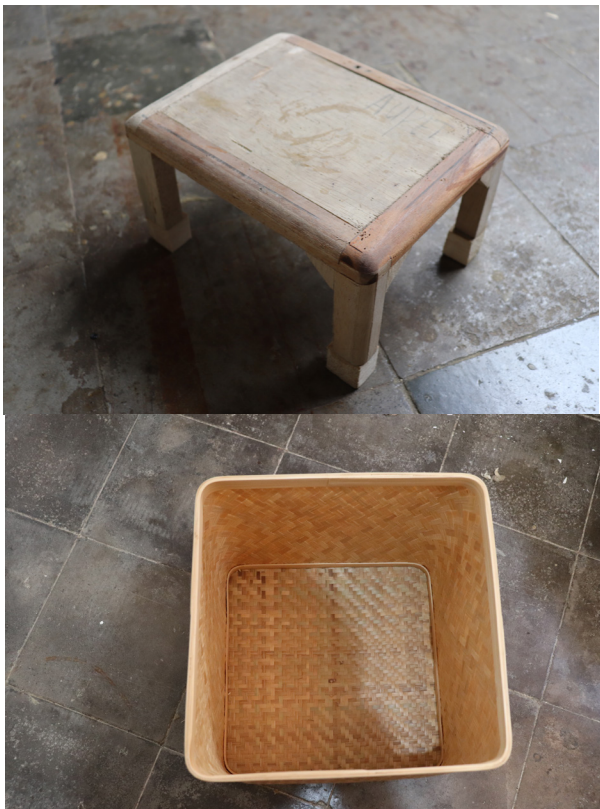
Gambar 7. Pola Lingkaran dan Produk Pola Lingkaran