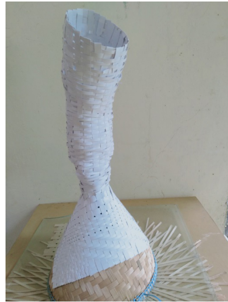
Gambar 10. Pengembangan Model Anyaman Pola Tradisional/ Aseupan

Dalam penelitian ini yang memberikan peluang bentuk dan teknik adalah ujung bagian