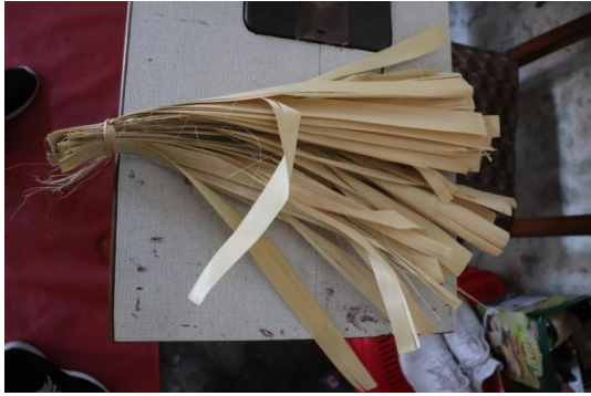
Gambar 2. Bahan Baku Bambu Halus