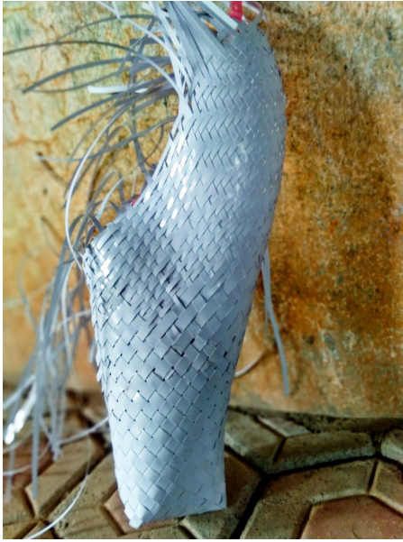
Gambar 9. Pengembangan Model Anyaman Pola Tolomong/ Besek