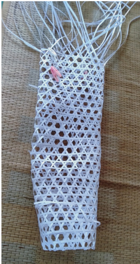
Gambar 13. Pengembangan Anyaman Pola Carangka (persegi dengan jarak media anyam yang renggang)