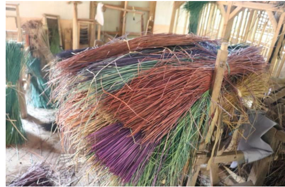
Gambar 4. Bahan Baku Mendong

sesuai dengan fungsi atau peruntukannya. Pertama bambu kasar yang biasa digunakan untuk membuat wadah-wadah benda/makanan seperti boboko , nyiru , bubu , bilik , dan sebagainya. Kedua adalah bambu halus, yang digunakan sebagai bahan dasar kerajinan anyaman untuk membuat tas, kipas, dompet, dan sebagainya.