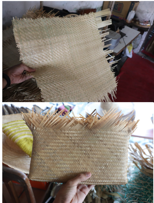
Gambar 5. Pola dan Produk Pola Joher

Bagi perajin, pola sangat membantu sebagai acuan dasar dalam membuat suatu produk yang bersifat masif atau masal, agar produk yang dihasilkan memiliki kualitas yang sama baik dari motif maupun ukurannya. Dalam penelitian ini, penulis akan merumuskan pola baru berdasarkan pola lama yang telah ada. Tujuannya untuk mengembangkan bentuk karya yang bersifat lebih dinamis dan lebih estetis. Jika perajin menggunakan pola anyam sebagai acuan dalam membuat karya/produk fungsi, maka penulis menggunakan pola anyam sebagai acuan dalam membuat karya seni yang bersifat ekspresif/murni. Diharapkan pola yang dihasilkan bisa menjadi referensi atau acuan bagi seniman atau pelaku seni yang ingin berkarya menggunakan teknik dan media anyam.