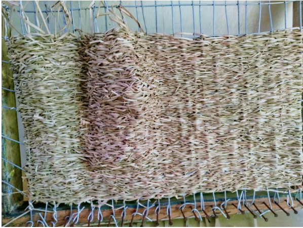
Gambar 11. Pengembangan Model Anyaman Pola Dua Dimensi