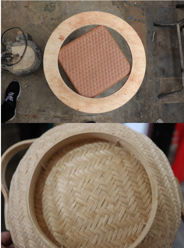
Gambar 7. Pola Lingkaran dan Produk Pola Lingkaran