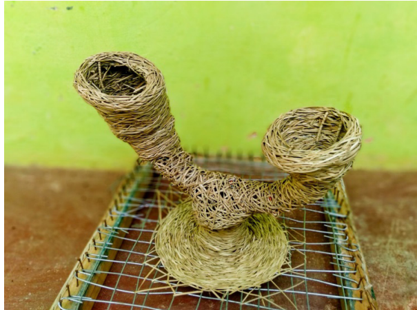
Gambar 12. Pengembangan Model Anyaman Pola Tiga Dimensi

Setelah pembentukan kerangka konstruksi material kawat dan lembaran iratan pandan sebagai konstruksi sekunder, proses menganyam dapat dimulai dengan menganyamkan lembaran iratan diantara kawat konstruksi dengan teknik tindih, tumpang, dan lilitan. Sedangkan pola nya secara garis besar adalah pola selang 1, selang 2, 3, lilitan ( random ) ke arah yang sama dengan