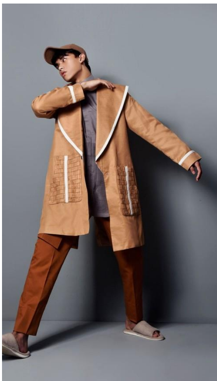
Gambar 6. Foto Karya 2

Berdasarkan produk yang dihasilkan dari penelitian ini dengan judul Gritty Of Jouney dapat dilihat bahwa pengaplikasian teknik anyaman untuk busana muslim yang bergaya casual sporty dapat di terapkan. Pada desain dan foto karya 1 teknik anyaman diaplikasikan pada bagian punggung belakang jacket dan untuk teknik opnaisel diterapkan pada bagian flap depan jacket dan bagian paha celana, untuk bagian kemeja menggunakan potongan kerah ciangi (kerah mandarin) dengan potongan lengan menggunakan batik garutan, gaya casual sporty semakin terlihat ketika pakaian tersebut ditambah dengan penggunaan sepatu model sneakers berwarna putih sehingga tampilan pada look 1 terkesan comfortable dan modern .