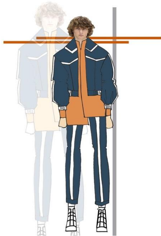
Gambar 3. Desain 1