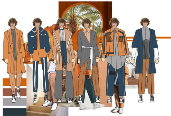
Gambar 2. Desain Koleksi

lebih ergonomis dan tidak membentuk lekuk tubuh juga memberikan kesan kokoh. Komposisi setiap elemen yang terdapat pada moodboard diatur sedemikian rupa sehingga menyiratkan prinsip-prinsip desain, dimana keseimbangan dan kesatuan menjadi point of interest dalam setiap proses pembuatan karya seni maupun desain.