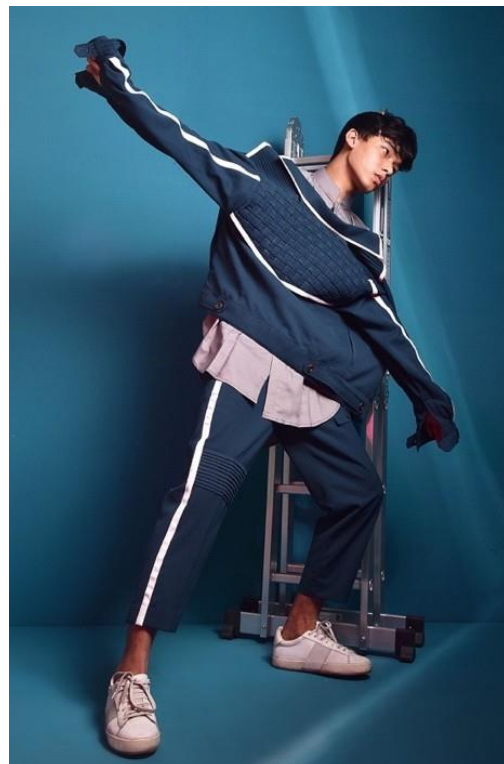
Gambar 4. Foto Karya