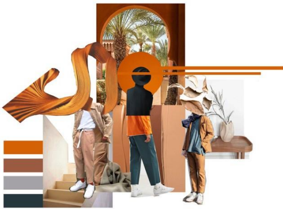
Gambar 1. Moodboard

gambar yang dikomposisikan sebagai referensi untuk menentukan ide perancangan busana yang akan dibuat. Hal tersebut diwujudkan dalam bentuk kumpulan gambar yang berfungsi sebagai stimulan untuk memberikan gambaran keseluruhan konsep karya dan menjadi inspirasi perancangan produk.