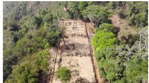
Gambar 2. Teras 3, Teras 4, dan Teras 5, Tampak Atas

Menurut Sutarman, dkk. [5], (5, 58-59), kegiatan Pengabdian kepada Masyarakat merupakan bentuk partisipasi dalam upaya pelestarian benda-benda bersejarah. Dalam kegiatan observasi, para pelaksana kegiatan bisa melakukan inventarisasi artefak dalam bentuk dokumentasi, sehingga meminimalisasi potensi hilangnya peninggalan sejarah. Hasil observasi dan wawancara kemudian dapat disusun menjadi profil dan laporan dokumen, sehingga informasinya menjadi akurat dan dapat digunakan oleh para pemandu wisata, serta menghasilkan kegiatan lanjutan yang terstruktur. Hal ini penting, karena pengetahuan tentang situs yang masih belum mendalam. Kelengkapan sarana maupun prasarana pun secara bertahap perlu terus diupayakan. Oleh karena itu, Tim pelaksana Pengabdian kepada Masyarakat perlu berinteraksi dan bergabung dengan masyarakat setempat, dan tentunya juga bekerja sama dengan komunitas lain.