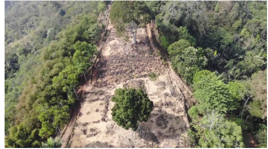
Gambar 1. Teras 1 dan Teras 2, Tampak Atas